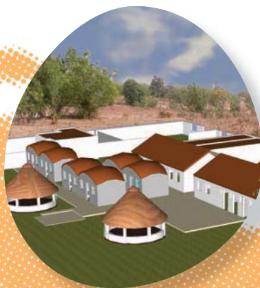
● Gambia Proyecto de Cooperación y desarrollo dirigido a la población maternoinfantil.